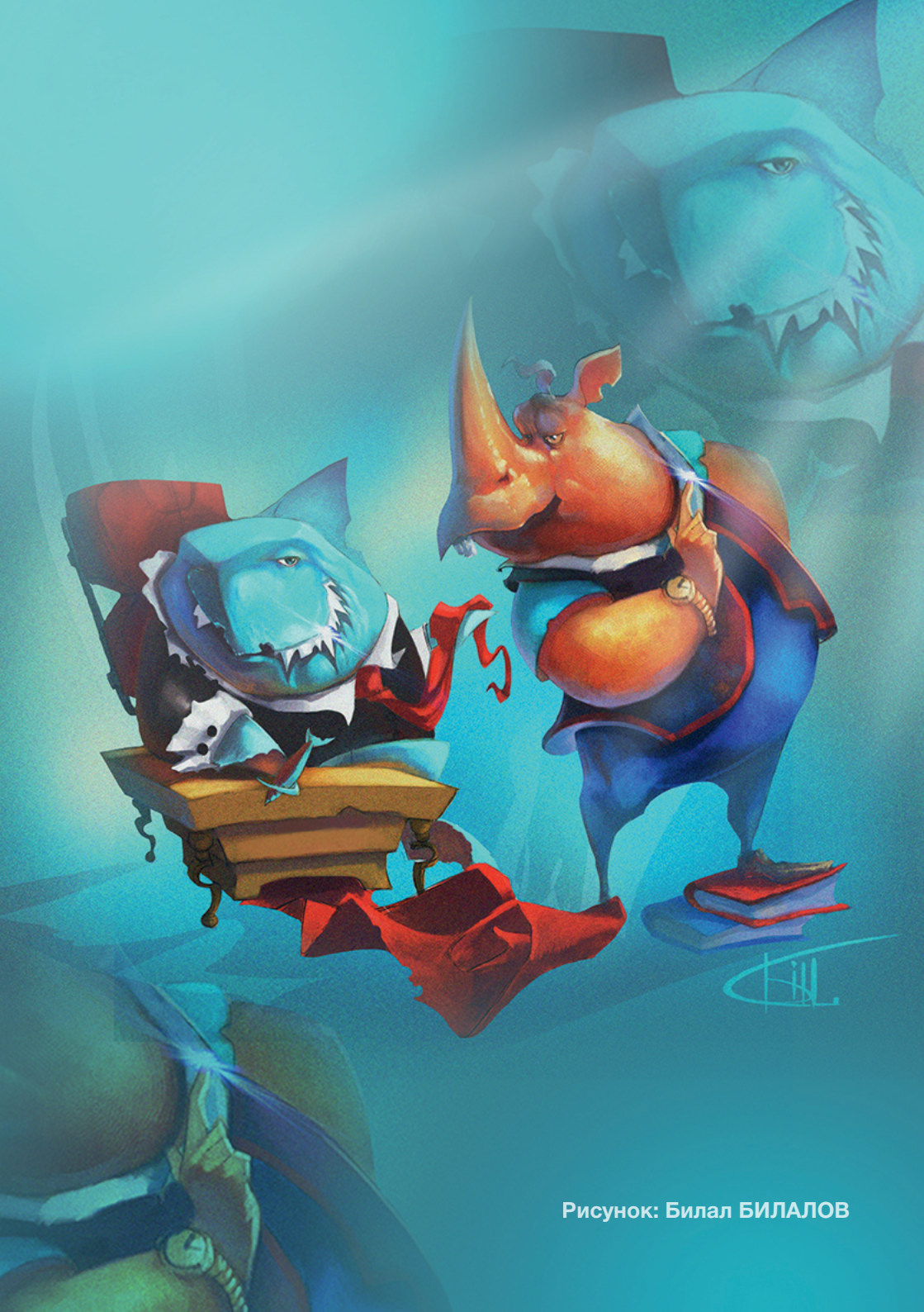
Рисунок: Билал БИЛАЛОВ